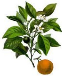
Petit grain bigarade

Les autres thématiques sont : Le lâcher prise – le stress et l'insomnie – les douleurs musculaires – les jambes lourdes – la constipation – la gastroentérite et les infections intestinales – la grippe, le rhume, la sinusite, le saignement du nez – la fin de vie.