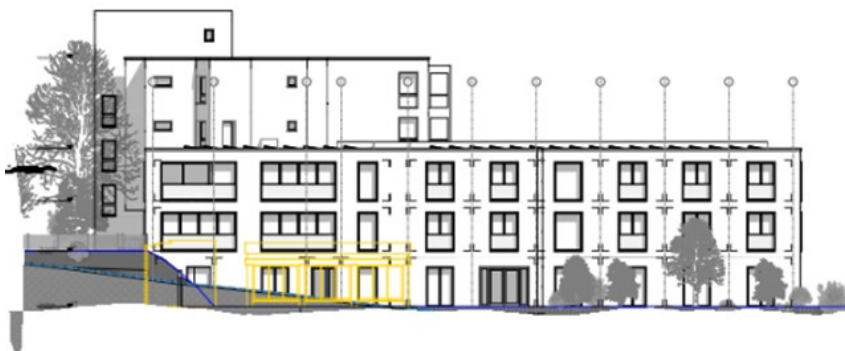
Nouveau bâtiment vu depuis la Fondation Fribourg pour la Jeunesse